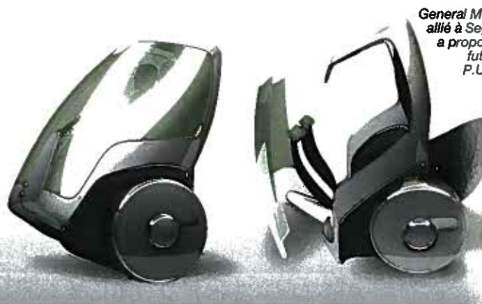
General Motors a proposé un futur P.U.

Dernier concept en date, et non moins étonnant: le Movilo, un véhicule urbain électrique primé par la Nissan, conçu par Tai Chiem, un designer australien. Châssis en carbone et arrière intégrant un moteur électrique, sa partie haute est totalement amovible. Il sera possible d'associer deux batteries à une carrosserie afin d'en faire une micro-citadine biplace à 4 roues. À l'heure des pistes, plus ou moins réalistes, seul l'avenir saura nous dire lesquels étaient viables. ■ N. Le Frap